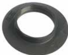
Roth QuickBox® flanger Til vægge med PVC/vinyl, VVS-nr. 087274.490 Til vandtætte baderumsplader, VVS-nr. 087274.575