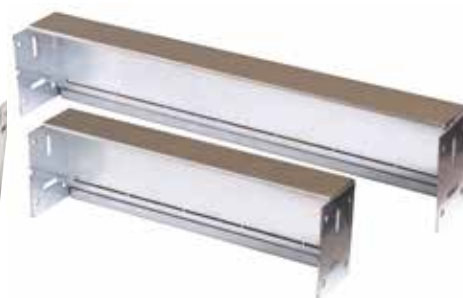
Roth QuickBox® justerbare skinner Fås i 2 størrelser: 220 - 400 mm, VVS-nr. 087277.620 330 - 600 mm, VVS-nr. 087277.630