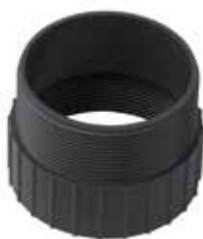
Roth QuickBox® forlænger, 30 mm VVS-nr. 087274.495