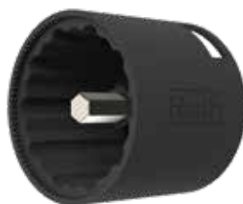
Roth QuickBox® værktøj Til flange. VVS-nr. 087289.252