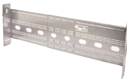
Roth justerbart vægbeslag Beslaget kan justeres fra 330-600 mm. VVS nr. 087277.565