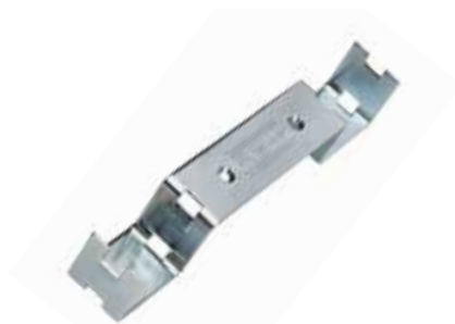
Roth QuickBox® armaturfix Til mur C/C 150 mm. VVS-nr. 087288.250