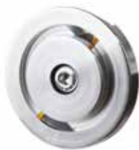
Roth QuickBox® fræser VVS-nr. 087289.210