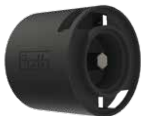
Roth QuickBox® fræseværktøj Plast. VVS-nr. 087289.251