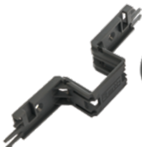
Roth QuickBox® monteringsæt til pladevæg VVS-nr. 087277.470