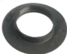
Roth QuickBox® flange til pladevæg VVS-nr. 087277.490